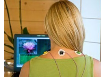
Elektromyographie bei muskulären Verspannungen und Spannungskopfschmerz