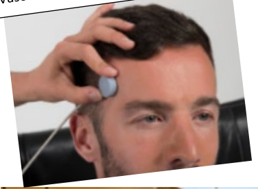
Vasokonstriktionstraining bei Migräne